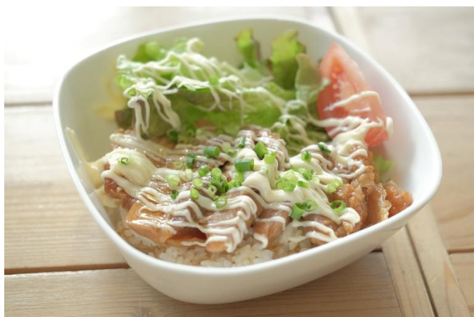
甲州地どりの照り焼き丼 1000円 (ドリンク付き)