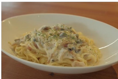
ベーコンとしめじの チーズクリームパスタ 1000円 (サラダ・ドリンク付き)