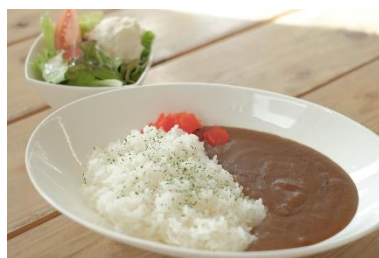
カレーライス 850円 (サラダ・ドリンク付き)