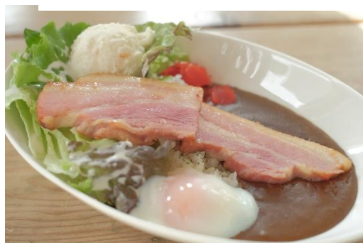
ベーコンカレー 1200円 (ドリンク付き)