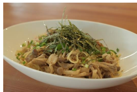
ベーコンときこの 和風味噌パスタ 1000円 (サラダ・ドリンク付き)