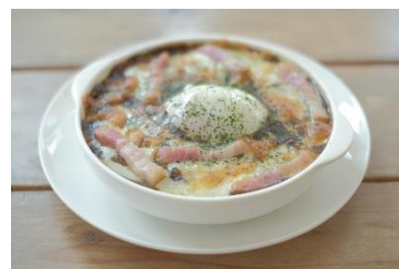
温玉カレードリア 1000円 (サラダ・ドリンク付き)