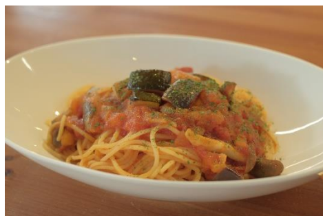
ベーコンと彩り野菜の トマトパスタ 1000円 (サラダ・ドリンク付き)