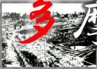
多摩川改修工事の現場（多摩川改修工事）