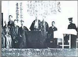
多摩川沿河開墾の功績を祝する式典（多摩川改修工事）