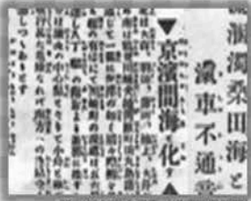
明治43年洪水記事（横浜貿易新聞）