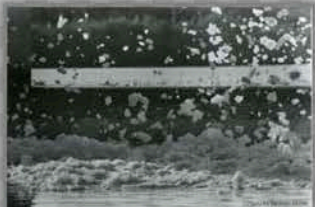
1971巨大な池の園まり