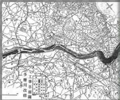
多摩川改修工事平面図