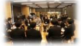
フリートークの様子

“ 県職員ってどんな仕事をしているの？ ” “ 仕事の魅力、やりがいは？ ” そんな疑問にお応えします。