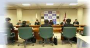
部局別業務説明の様子